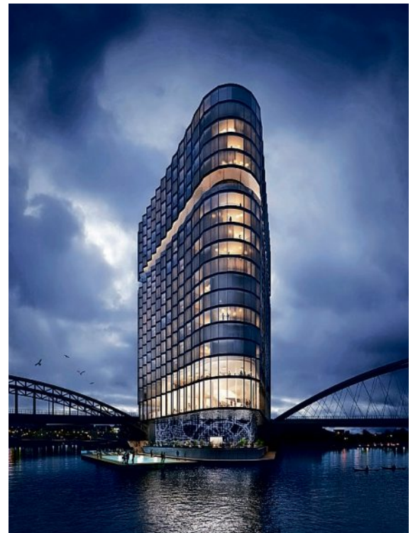
2. Preis: Hadi Teherani Architects, Hamburg