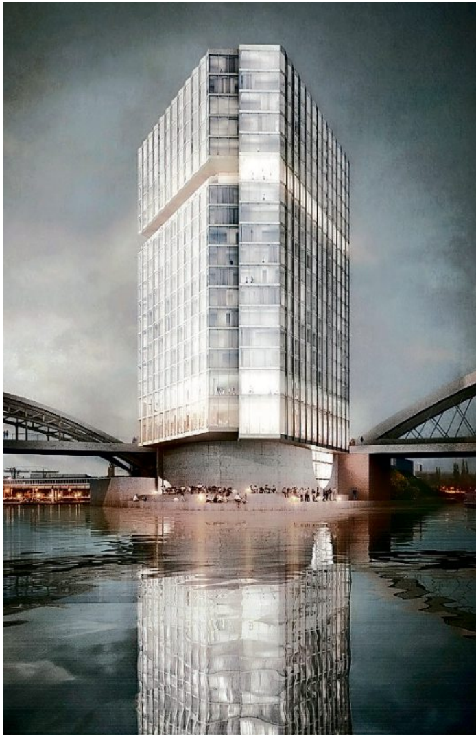
1. Preis: Barkow Leibinger Ges. v. Architekten, Berlin