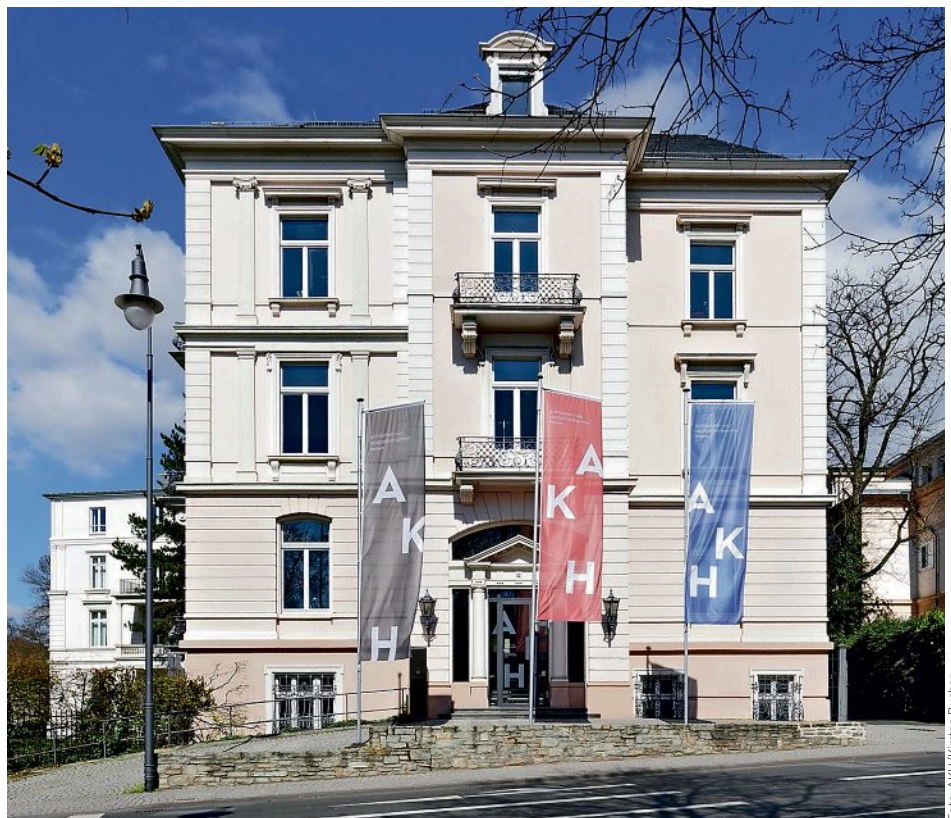
Das Haus der Architekten in Wiesbaden.