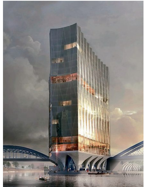
2. Preis: KSP Jürgen Engel Architekten, Frankfurt/Main

Die kompletten Wettbewerbsergebnisse und weitere aktuelle Informationen finden Sie im Internet unter: www.akh.de . Bei Fragen hierzu wenden Sie sich bitte an Herrn Soleiman Wahed (Telefon: 0611 - 17 38-38).