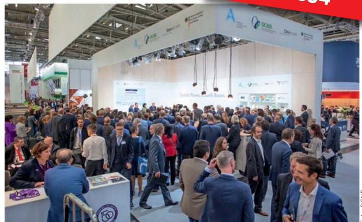
Der Stand der Architektenkammern war 2018 gut besucht und Anlaufstelle für den Berufsstand.