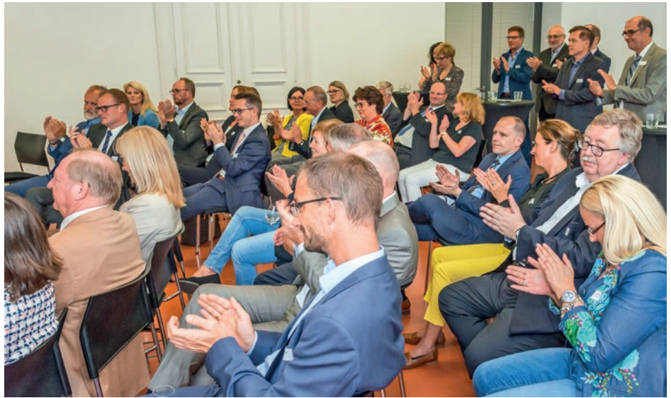
Mehr als 40 Teilnehmer aus 15 hessischen Kammerorganisationen kamen ins Haus der Architekten.