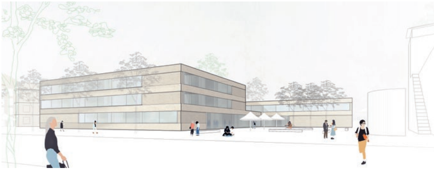
3. Preis: MGF Architekten GmbH mit W+S Wiedemann Schweizer Landschaftsarchitektur, beide Stuttgart

des neuen Kita- und Grundschulstandorts lieferte nun der ausgelobte Realisierungswettbewerb, der vom ortsansässigen Büro Stadtbauplan GmbH betreut worden war. Das Preisgericht vergab unter den 22 eingereichten Arbeiten drei Preise und drei Anerkennungen.