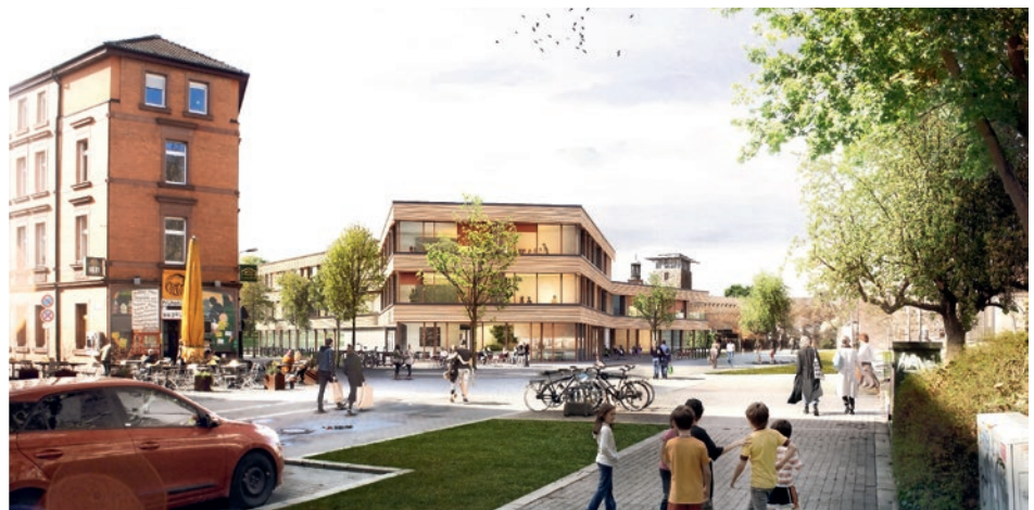
2. Preis: Dietrich | Untertrifaller Architekten GmbH, München, mit Wenzel+Wenzel Fr. Arch. PartgmbB, Karlsruhe, und Storch Landschaftsarchitektur, Dresden

tionen Kita und Grundschule konzeptionell eng zu verknüpfen, Übergänge neu zu gestalten und somit nahtlose Bildungsbiographien zu ermöglichen. Vorschläge für die Gestaltung