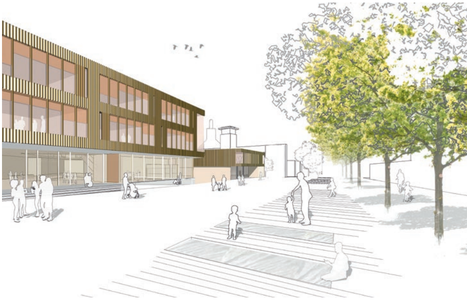
1. Preis: v-architekten GmbH mit rmp Stephan Lenzen Landschaftsarchitekten, beide Köln

Fachrichtung: Hochbau, Landschaftsarchitektur